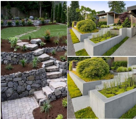
شكل رقم (12) نموذج حاويات الزرع.

- حاويات النباتات: يجب أن يكون لها مخارج لتصريف المياه وذات قوة تحمل ومتانة وشكلها جيد في الوقت ذاته، كما يتلائم حجمها مع العناصر المحيطة.