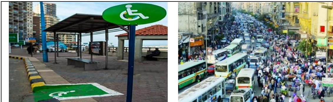
شكل رقم (1) جانب من الصورة المتكررة في الشوارع المزدهمة والتي تفتقد الكثير من معايير الراحة. وفي المقابل إحتياجات فئة معينة من المواطنين (ذوي القدرات الخاصة) لتسهيل إستخدامهم، وهذا دور مجال تنسيق المواقع. (الصورة الأولى في العتبة القاهرة - والصورة الثانية علي كورنش البحر الإسكندرية)

فالتصميم المجتمعي الجيد من أهم مبادئه تحقيق رضي مستخدميه. فالسعادة والرضي الحقيقي هما شعور الفرد بالإشباع الإلتفاعي، ويظهر ذلك عندما يقول الفرد... أنا مستمتع بهذه الخبرة وأحب أن تستمر تجربتي وأنا راضي عن الخدمة المقدمة لي وأنا سعيد جداً. وهذا لا يتحقق إلا من خلال دراسة إحتياجات المستخدمين في الفراغ الذي يعيشون فيه، مما يتطلب قياس إحتياجات المستخدمين من خلال عدة أدوات مثل الملاحظة بالدراسة الميدانية أو إستبيان مقنن ومدرس وتحليل البيانات الناتجة، أو غير ذلك من أدوات الدراسة وإدخال نتائجها كمدخل أساسي في عملية التصميم التي يقوم بها المصمم.