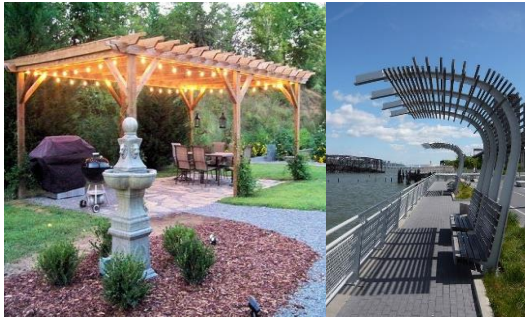
شكل رقم (14) نموذج لعنصر البرجولات.

- البرجولات: يفضل استخدام المواد التي تتوافق مع العناصر الأخرى المحيطة كأنواع الخامات المستخدمة في الأرضيات والفرش. - يجب مراعاة توزيعها في المكان بحيث تكون أماكن للراحة المظللة في المكان.