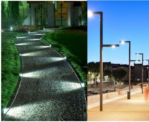
شكل رقم (11) نموذج الإضاءة.

- وحدات الإضاءة : يمكن إستخدام نوعية الإضاءة الغامرة عن طريق أعمدة الإنارة أو الإضاءة الموجهة نحو العناصر المحيطة أو بتثبيتها علي جدران المباني، مع مراعاة أن تكون كل الإضاءة التي تستخدم ليلا للتجميل شكلها جيد نهاراً أيضا وهي مطفأه. وفي مسارات السيارات يجب تجنب الإبهار أو إعاقة الرؤية للسائق.