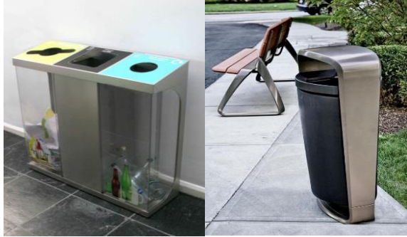
شكل رقم (10) نموذج لسلات المهملات.

- وحدات الإضاءة : يمكن إستخدام نوعية الإضاءة الغامرة عن طريق أعمدة الإنارة أو الإضاءة الموجهة نحو العناصر المحيطة أو بتثبيتها علي جدران المباني، مع مراعاة أن تكون كل الإضاءة التي تستخدم ليلا للتجميل شكلها جيد نهاراً أيضا وهي مطفأه. وفي مسارات السيارات يجب تجنب الإبهار أو إعاقة الرؤية للسائق.