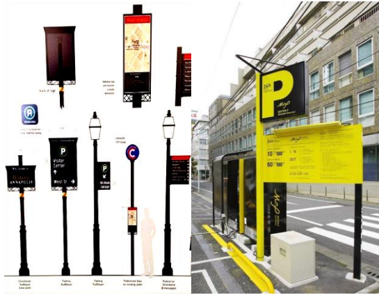
شكل رقم (13) نموذج للافتات.

حركة السير فالمستخدم يتباطأ عندها ويقف أمامها لبعض الوقت. - يجب أن تغطي كل أو معظم الأماكن للإرشاد والتوجيه الصحيح للمستخدم دون دليل.