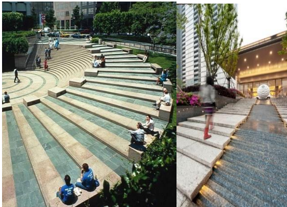
شكل رقم (15) نموذج لعنصر السلالم.

- السلالم: كلما قلت زاوية ميل السلم كلما كان أكثر راحة في الحركة وأمان. - يجب مراعات مقاييس وخامات ذوي الإعاقة.